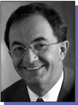
Erwin Staudt, Präsident, VfB Stuttgart 1893 e.V., Stuttgart